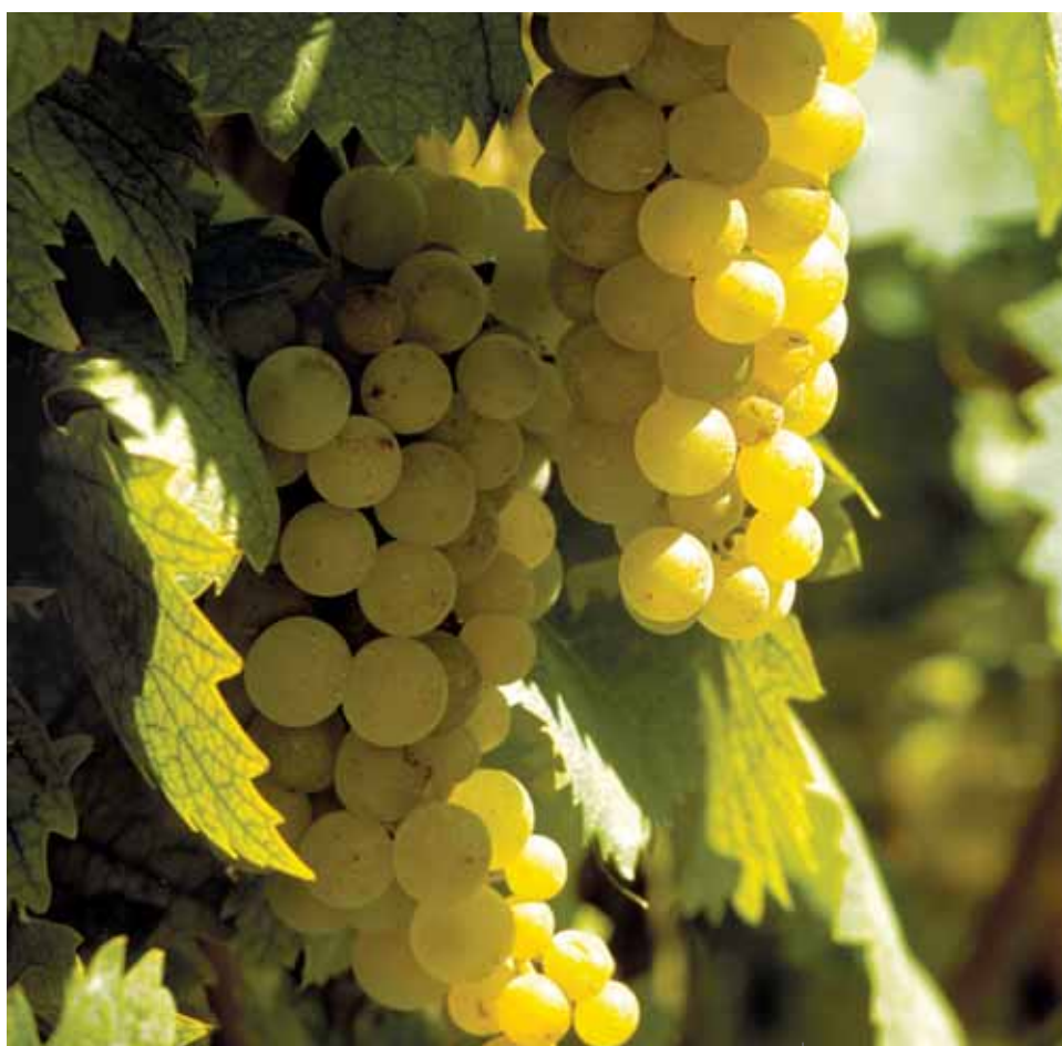
Grappolo di moscato.

Le DOCG sono due e tutelano il vino dal novembre 1993, con successive modifiche entrate in vigore due anni dopo nel 1995. La denominazione Asti, senza l'aggiunta di altra indicazione o se accompagnata dalla parola Spumante (Asti o Asti Spumante) contraddistingue unicamente la tipologia del vino spumante. La stessa denominazione, con la dicitura Moscato o Moscato d'Asti, è riservata al vino bianco non spumantizzato.