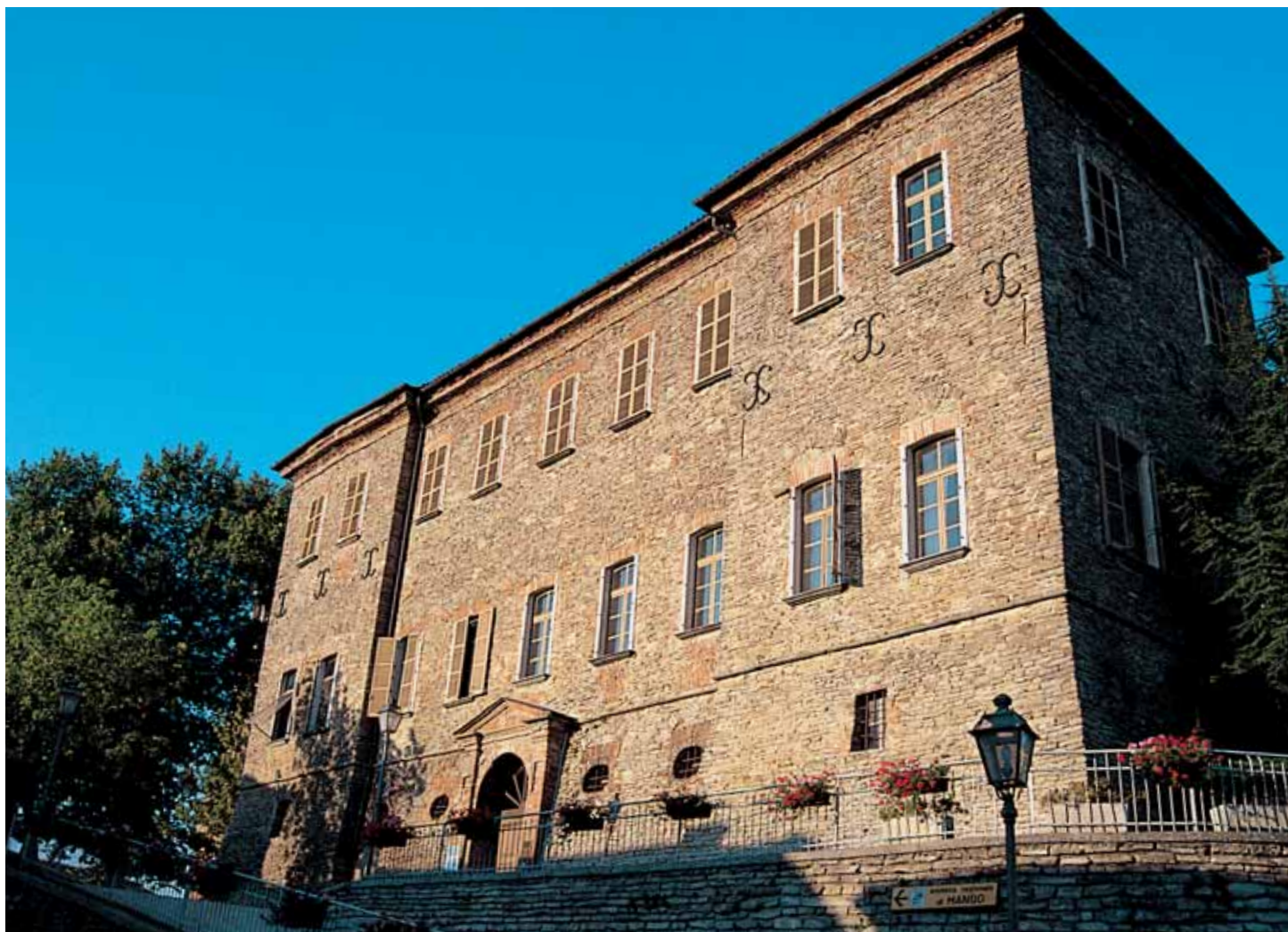
Il Castello di Mango.

Madonna del Buon Consiglio sulla strada che scende al Boglietto. Da Castiglione raggiungiamo in cresta Valdivilla (che è pur sempre frazione di Santo Stefano) dove nell'ex Convento di San Maurizio ha trovato posto oggi un Relais a 5 stelle con annesso ristorante (niente meno che il celebre Guido da Costigliole, proprio come la Contessa!).